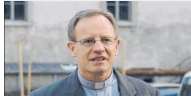
Den Papst treffe keine Schuld, sagt Trauffer.

Der Generalvikar des Bistums Basel nimmt Papst Benedikt in einem Zeitungsartikel in Schutz.