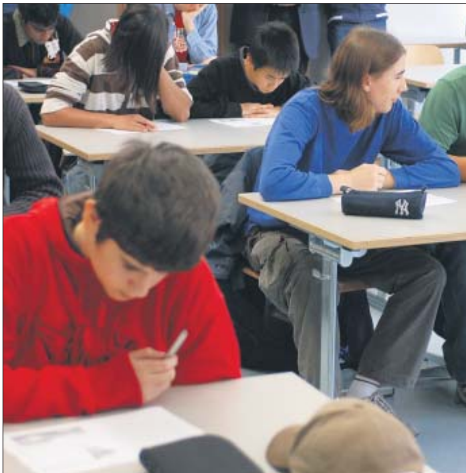
Helden, Clowns und Sündenböcke: Schüler sind oft in Rollen festgefahren.

Ganz billig ist das Programm nicht: Das Engagement des Forumtheaters kostet 3200 Franken, die Weiterbildung zwischen 1500 und 4400 Franken.